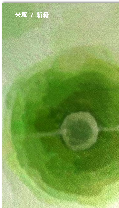
「阿蘇山上パステル画教室」は、阿蘇火山博物館開館記念行事とタイアップして実施されます。