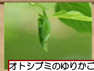
オトシブミのゆりかご

四季折々、見どころいっぱい箱根ビジターセンター周辺散策に、是非お出かけください♪