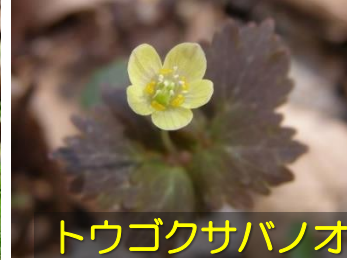
トウゴクサバノオ