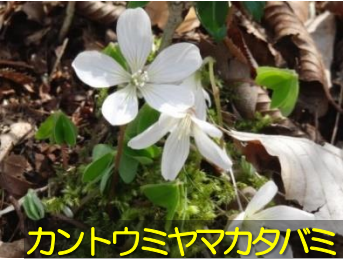
カントウミヤマカタバミ

春は歩くだけでも気持ちが良い、たくさんの花々が見られる時期です。目立たないけれど、出会うとうれしいものを写真で紹介します。他にも多くの花々に出会えるはず。ぜひゆっくり歩いて季節の移り変わりを感じてください。楽しみながら、この時期にしか見られない“いいもの”を探してみましょう！