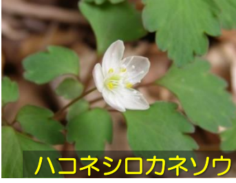
ハコネシロカネソウ