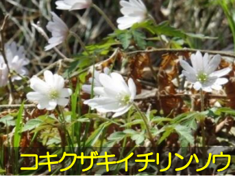
キクザキイチリンソウ