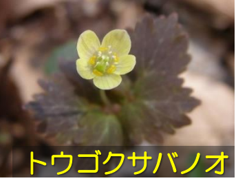
トウゴクサバノオ