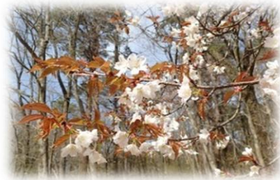
※写真はヤマザクラ

春紅葉とは、広葉樹の新芽が光合成で葉緑素を蓄える前に、元来もつ色素（赤や黄）が見える現象のことです。秋と同様にカエデ類の赤色が目立つため、「はるもみじ」と呼ぶこともあります。