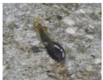
腹側。口が吸盤になっている