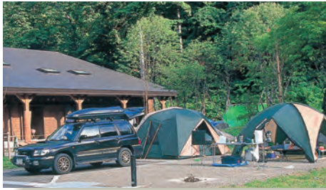
オートキャンプサイト (14区画)